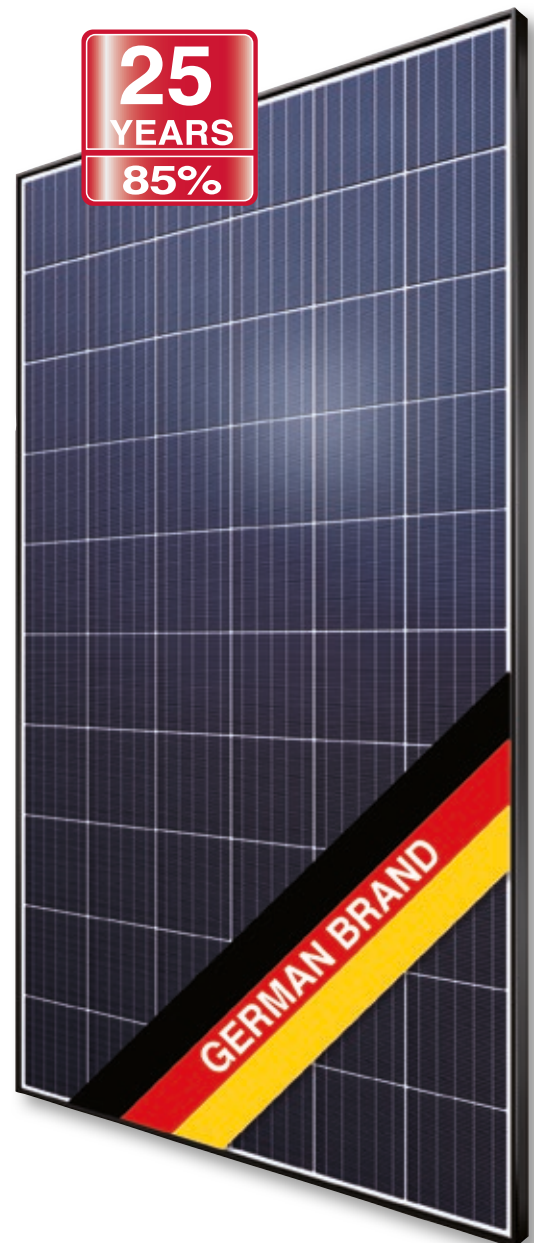
Abb. ähnlich 60MDE190513A

Exklusive lineare AXITEC Höchstleistungs-Garantie!